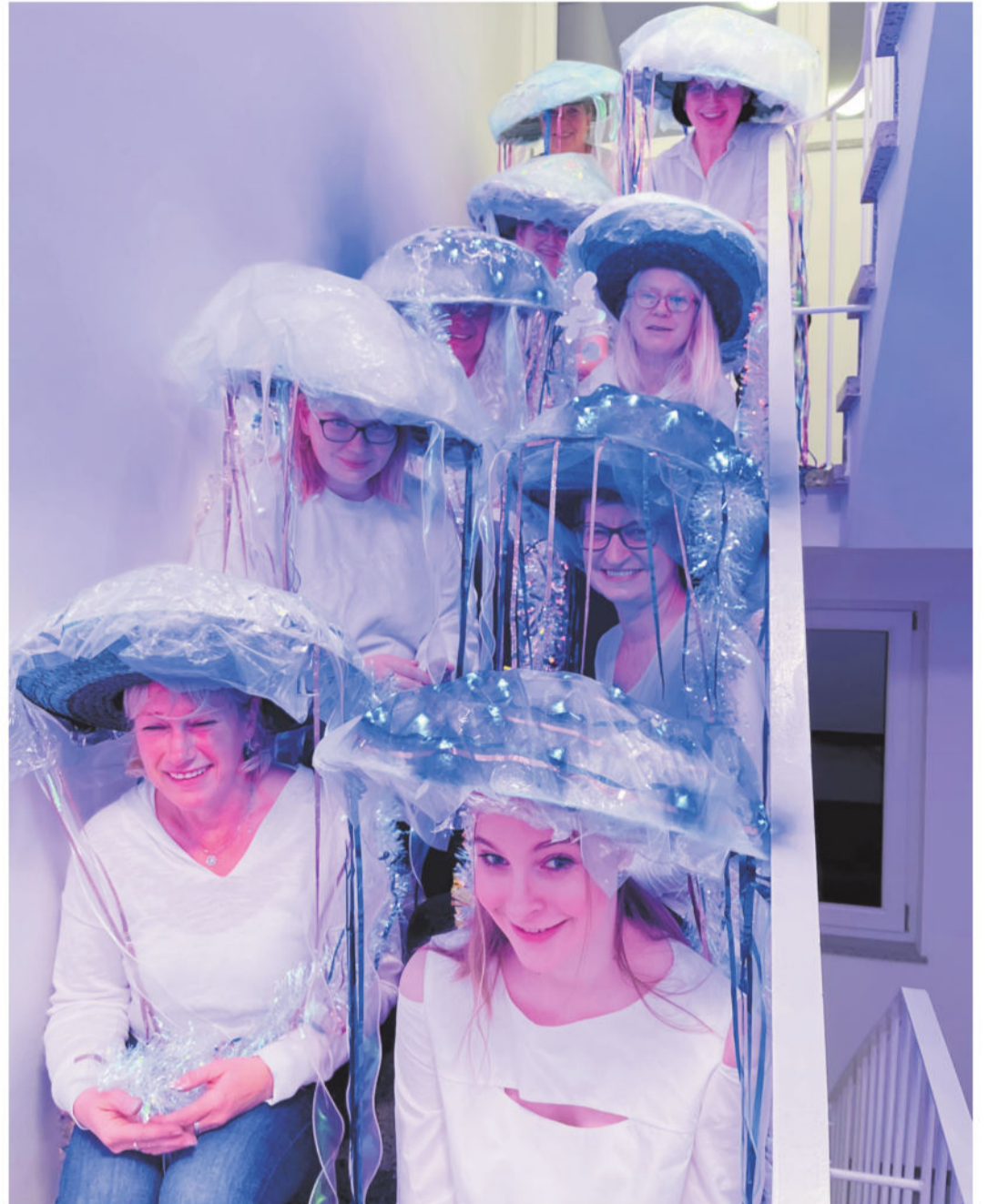
Eins der Bewerbungsfotos für den Wettbewerb

I m Laufe des Sommers 2023 hatten die Tönisvorster Karnevalsvereine mal wieder ihre Köpfe zusammengesteckt und überlegt, wie man nach den Coronajahren unseren schönen Tulpensonntagszug etwas beleben könnte.